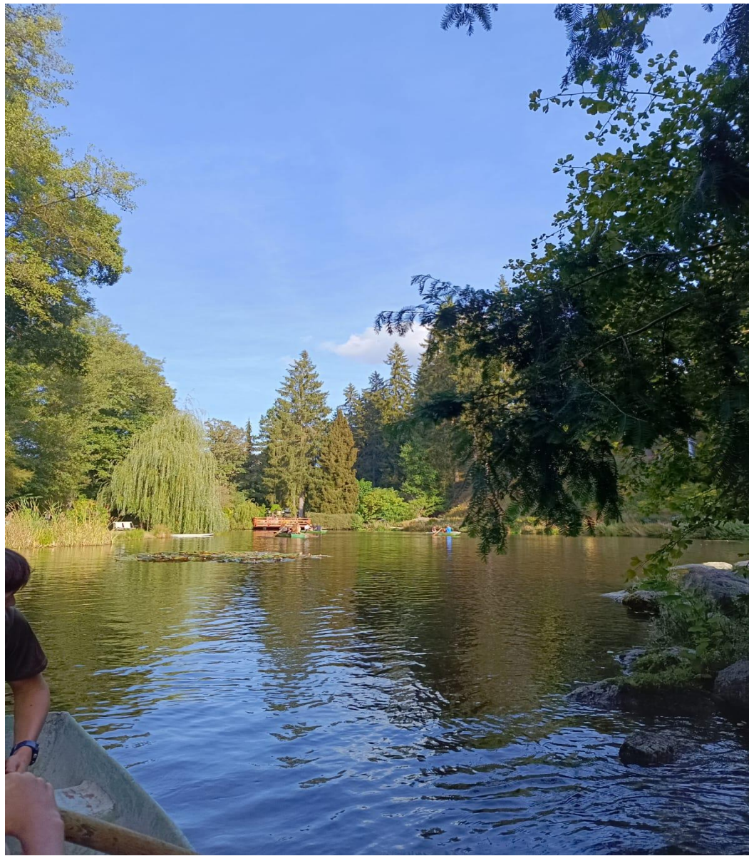
Rybník v botanické zahradě která je součástí CHKO Slavkovský les